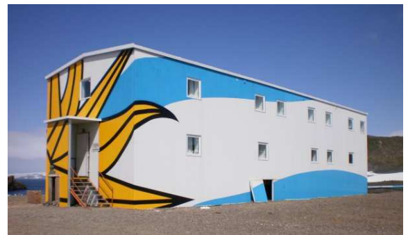
Nuevo aspecto del Aula de Interpretación de la Naturaleza Antártica (AINA) – enero de 2010