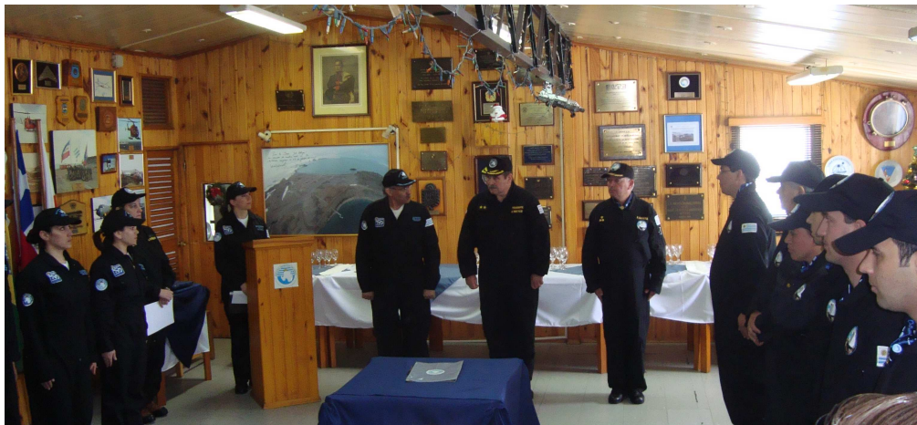
Momento de la ceremonia de relevo y celebración del 25º aniversario de la BCAA