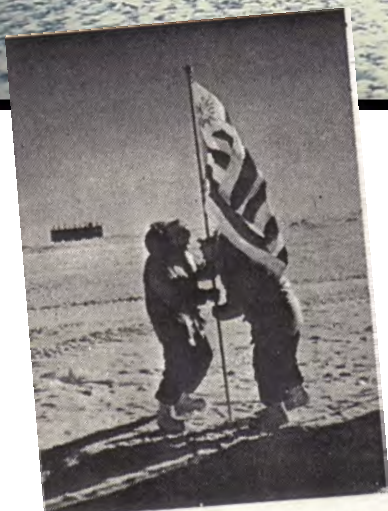
La bandera uruguaya luce en el Polo Sur geográfico.

Aspecto de la Base Científica Antártica Artigas en febrero de 2010.