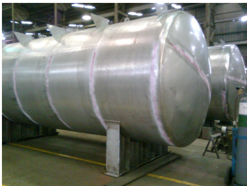
Primer Grupo de Tanques