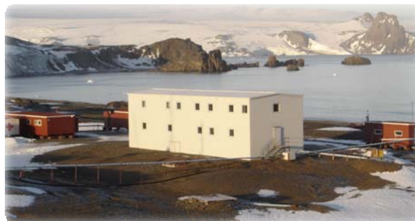
Base Científica Antártica Artigas