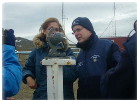
Príncipe Albert I de Mónaco en la BCAA