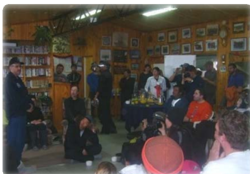
Universidad de Wharton (Pennsylvania) en la BCAA